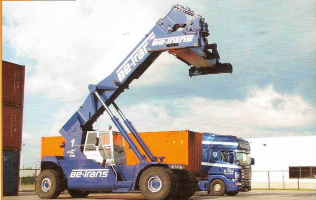
De nieuwe zetel van BE-Trans is sinds april 2007 operationeel.